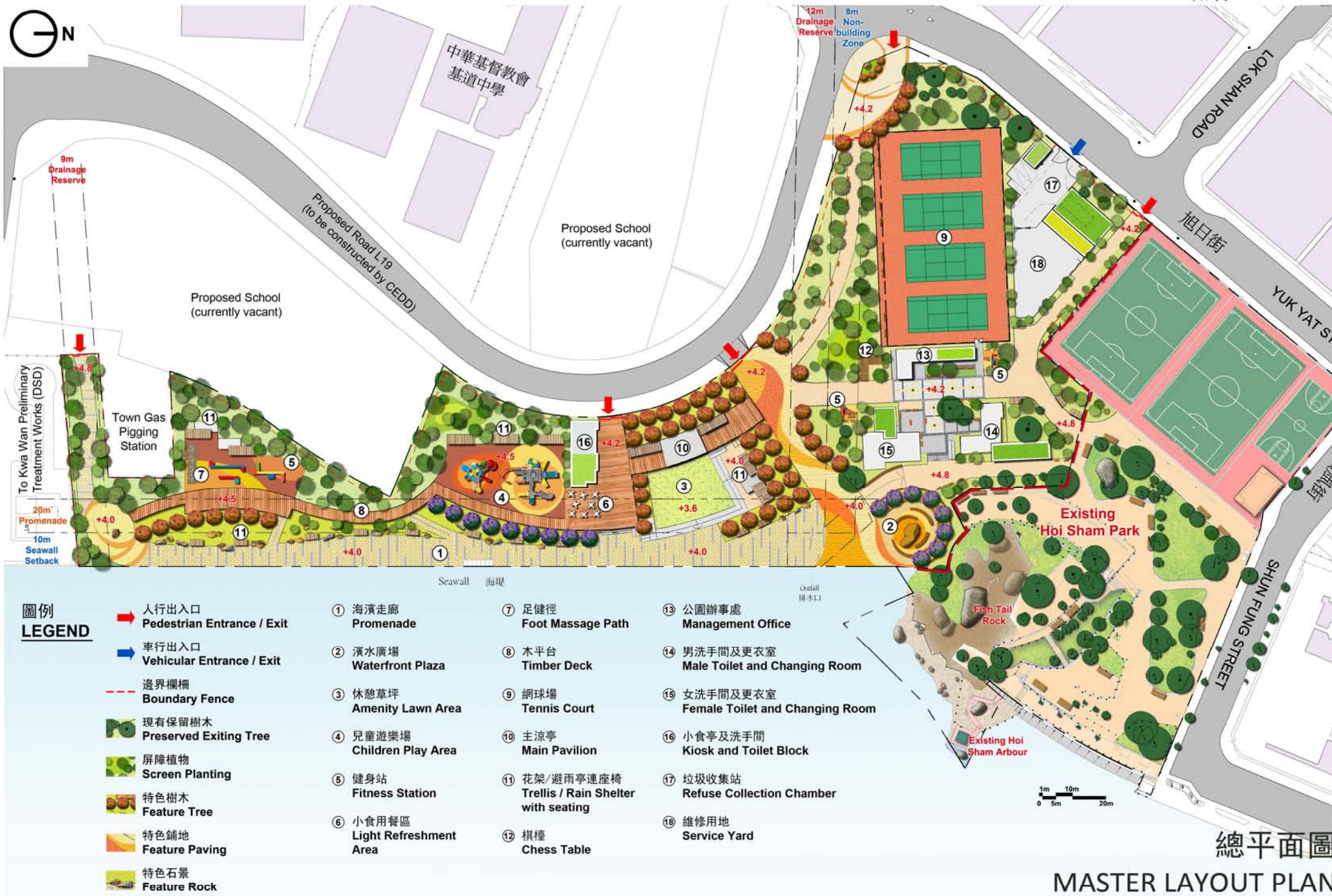
海心公園擴建工程以提供海濱長廊及重置高山道公園網球場 Hoi Sham Park Extension for Waterfront Promenade and Reprovisioning of Tennis Courts from Ko Shan Road Park